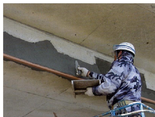
写真4-3 断面修復状況