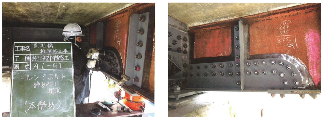
写真4-1 当て板工実施状況

激しい腐食による鋼部材の減厚が生じた箇所に対し、腐食箇所を取り囲むように当て板（添接版）を施すことにより鋼部材を補修する工法です。