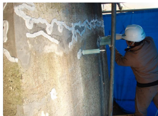
写真4-2 ひび割れ注入状況

ひび割れを塞ぐことにより、劣化因子（水分、塩化物など）の侵入を防止し、コンクリートの耐久性を向上することができます。