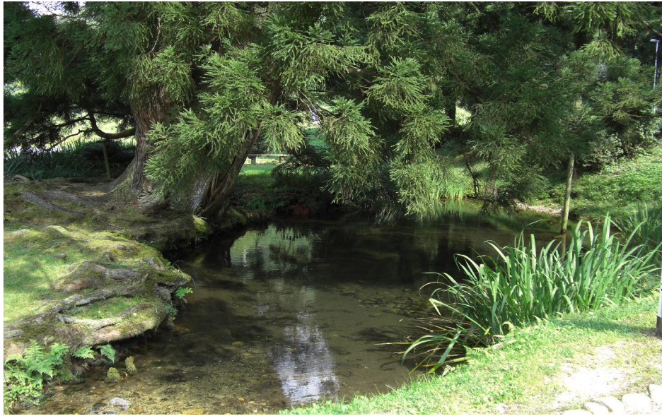
高津川水源地「大蛇ヶ池」