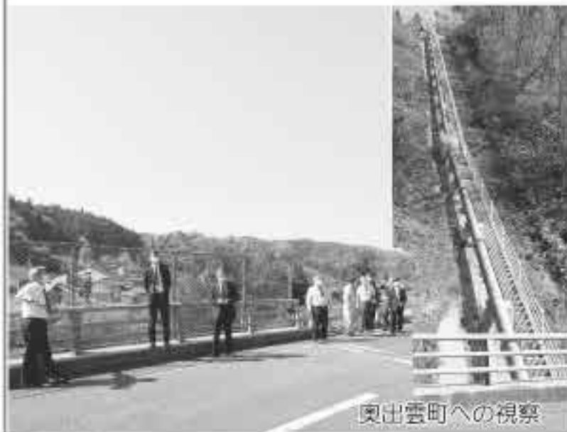
奥出雲町への視察

所感として、「当町は、清流高津川を有した「水源のまち」であり、脱炭素社会の実現に向け、再生可能エネルギーの新規事業については、今後積極的に調査・研究に取り組むべきである。」と報告しました。