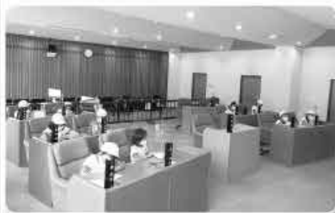
六日市小学校児童の皆さん