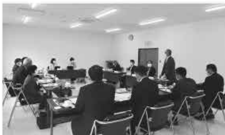
浜田市議会福祉環境委員の皆さん

5月12日に、浜田市議会福祉環境委員会の8名の委員が行政視察に来町されました。「よしかの子育ての取り組み、現状や課題について」をテーマに保健福祉課の課長・担当者が説明し、委員の皆さんと意見交換を行いました。