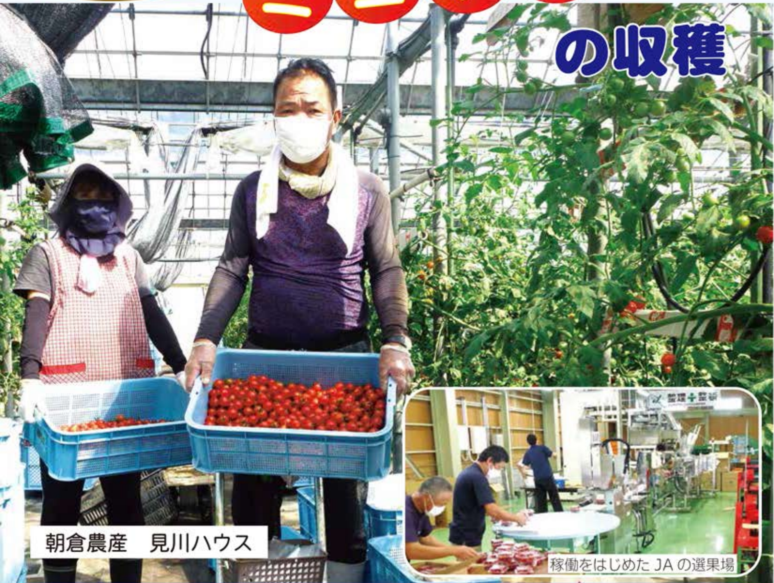
朝倉農産 見川ハウス