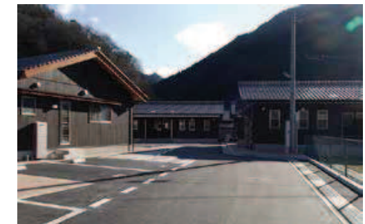
とびのこ山団地第2期建築工事