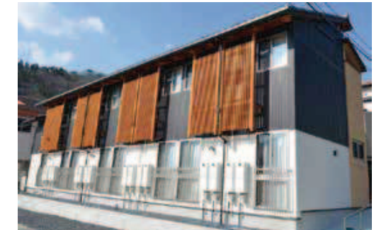
サクラマス交流センター整備事業