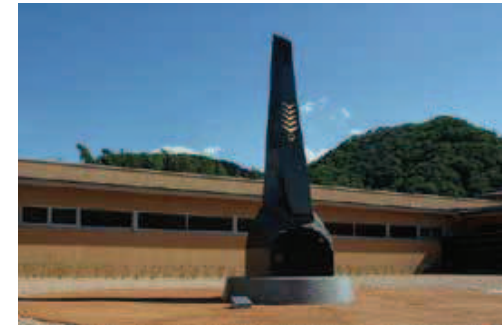
野外彫刻制作事業