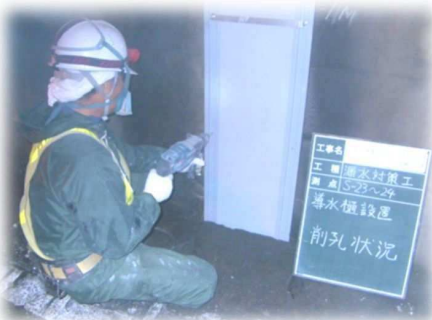
写真 3-2 線導水工