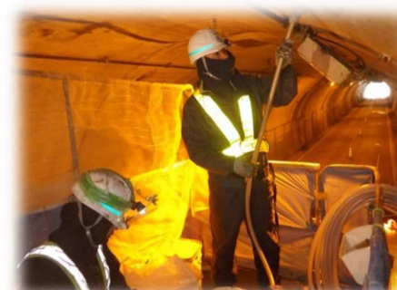
写真 3-4 裏込注入状況