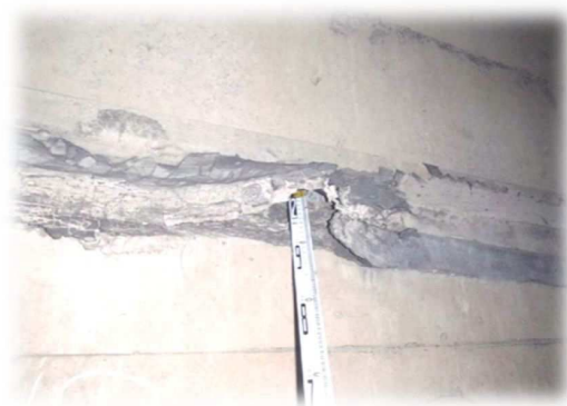
壁面打継部の剥離