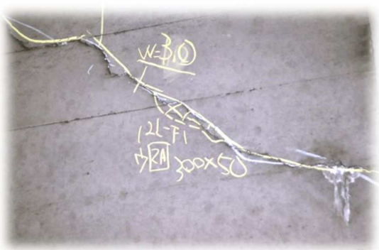
覆工アーチ部のひび割れ