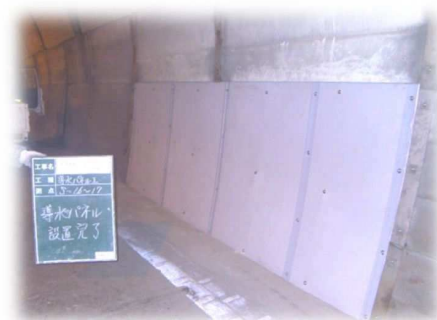
写真 3-3 面導水工