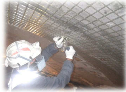
写真 3-1 FRP ネット設置状況