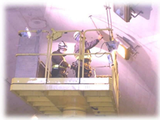
写真 2-1 トンネル点検状況