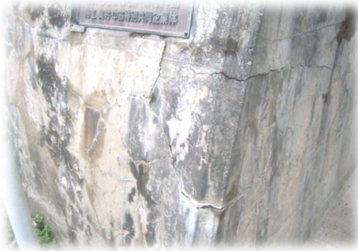
抗門面壁のひび割れ