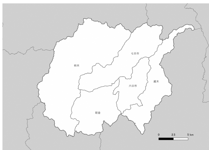
図表 2 計画区域と地区区分